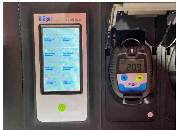
Fote rechts beneden: Interieur. Detailopname X-Dock 6600 (Display en PAC cradle zichtbaar).